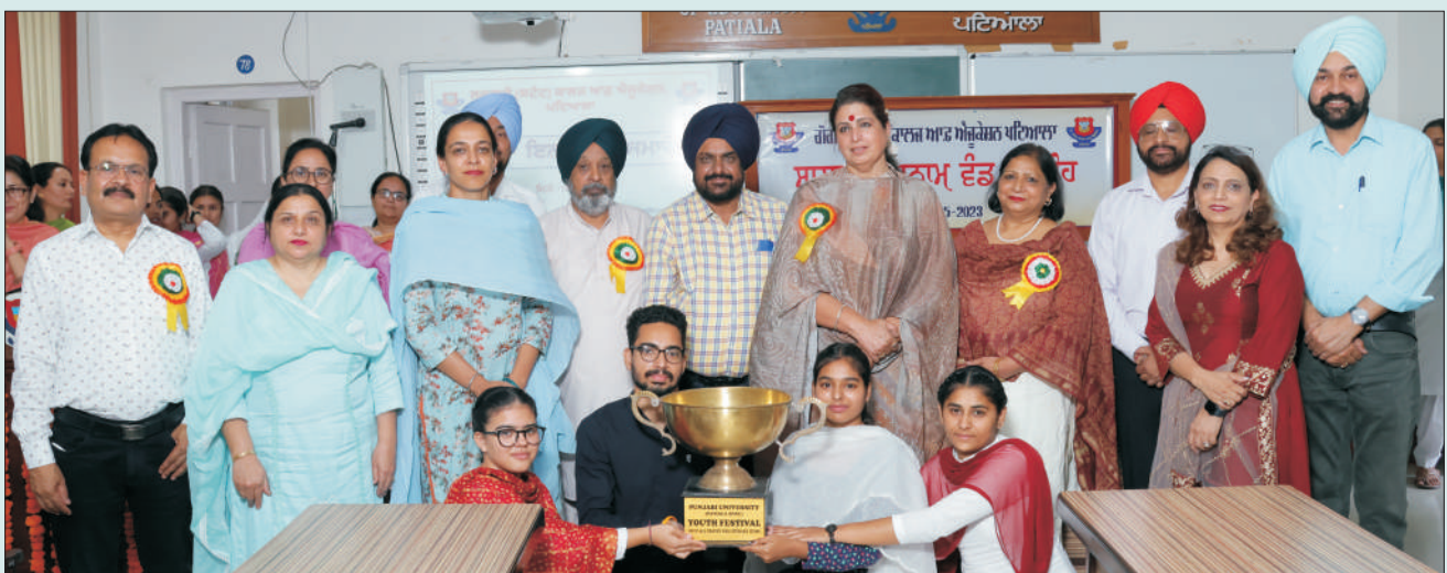
ਮਿਤੀ 18 ਮਈ 2023 ਨੂੰ ਸਲਾਨਾ ਇਨਾਮ ਵੰਡ ਸਮਾਰੋਹ ਦੌਰਾਨ ਜੇਨਲ ਯੂਥ ਫੈਸਟੀਵਲ 2022 ਦੇ ਜੇਤੂ ਵਿਦਿਆਰਥੀਆਂ ਨੂੰ ਆਵਰਆਲ ਸਾਹਿਤਕ ਟਰਾਫੀ ਪ੍ਰਦਾਨ ਕਰਦੇ ਹੋਏ ਮੁੱਖ ਮਹਿਮਾਨ, ਪ੍ਰਿੰਸੀਪਲ ਅਤੇ ਸਟਾਫ਼