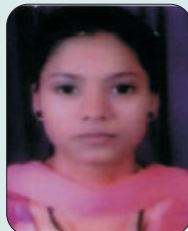
ਗਰੀਮਾ ਬੀ.ਐਡ.ਭਾਗ-i ਖੇਤਰੀ ਯੁਵਕ ਮੇਲਾ 2022 ਵਿੱਚ ਕਲਾਸਿਕਲ ਵੋਕਲ ਵਿਚ ਤੀਜਾ ਸਥਾਨ