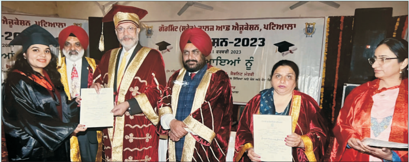
ਮਿਤੀ 11 ਫਰਵਰੀ 2023 ਨੂੰ ਕਨਵੋਕੇਸ਼ਨ ਦੌਰਾਨ ਮੁੱਖ ਮਹਿਮਾਨ ਡਾ. ਬਲਬੀਰ ਸਿੰਘ, ਕੈਬਨਿਟ ਮੰਤਰੀ, ਵਿਦਿਆਰਥੀਆਂ ਨੂੰ ਡਿਗਰੀ ਪ੍ਰਦਾਨ ਕਰਦੇ ਹੋਏ।