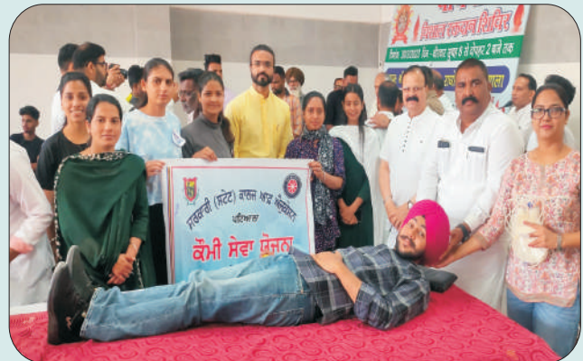
ਖੂਨਦਾਨ ਕੈਂਪ ਦੌਰਾਨ ਵਿਦਿਆਰਥੀ ਖੂਨ ਦਾਨ ਕਰਦੇ ਹੋਏ।