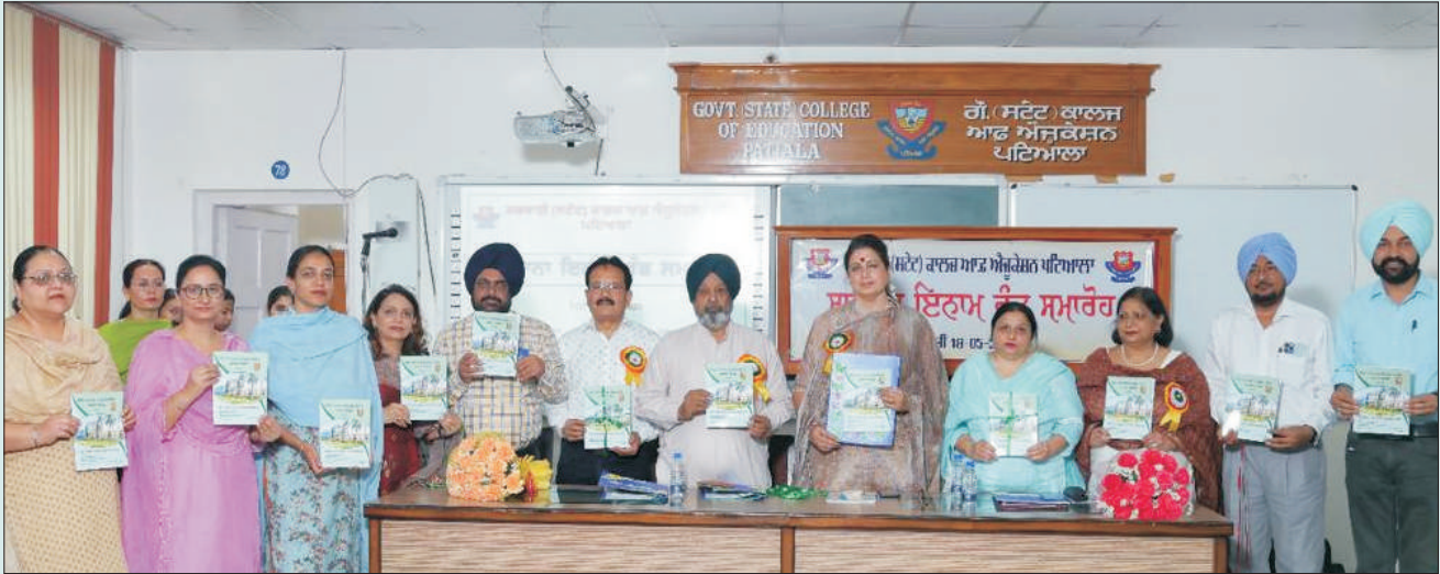
ਮਿਤੀ 18 ਮਈ 2023 ਨੂੰ ਕਾਲਜ ਦੇ ਸਾਲਾਨਾ ਰਿਪੋਰਟ ਅਤੇ ਕਾਲਜ ਮੈਗਜ਼ੀਨ ਨੂੰ ਰੀਲੀਜ਼ ਕਰਦੇ ਹੋਏ ਮੁੱਖ ਮਹਿਮਾਨ, ਪ੍ਰਿੰਸੀਪਲ ਅਤੇ ਸਟਾਫ