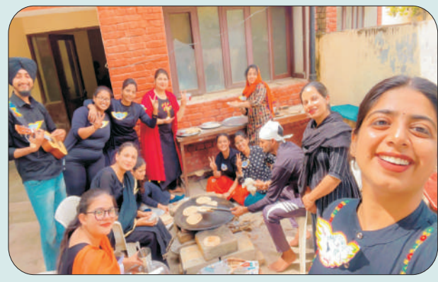
25 ਮਾਰਚ 2023 ਤੋਂ 31 ਮਾਰਚ 2023 ਤੱਕ 7 ਰੋਜ਼ਾ ਐਨ.ਐਸ.ਐਸ. ਕੈਂਪ ਦੌਰਾਨ ਵਿਦਿਆਰਥੀ ਖਾਣਾ ਤਿਆਰ ਕਰਦੇ ਹੋਏ