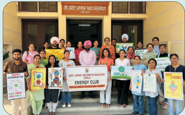
ਮਿਤੀ 8 ਮਈ 2023 ਤੋਂ 13 ਮਈ 2023 ਐਨਰਜੀ ਕਨਜ਼ਰਵੇਸ਼ਨ ਸਪਤਾਹ ਦੌਰਾਨ ਫਾਈਨ ਆਰਟਸ ਵਿਭਾਗ ਦੇ ਵਿਦਿਆਰਥੀਆਂ ਵੱਲੋਂ ਤਿਆਰ ਕੀਤੇ ਗਏ ਪੋਸਟਰ ਅਤੇ ਸਲੋਗਨ