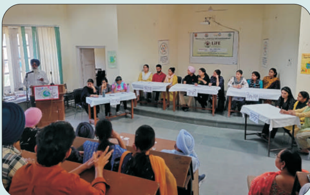
ਮਿਤੀ 20 ਅਪ੍ਰੈਲ 2023 ਨੂੰ ਈਕੋ ਕਲੱਬ ਅਤੇ ਜੋਗਰਫੀ ਵਿਭਾਗ ਵੱਲੋਂ ਆਯੋਜਿਤ ਕੁਇਜ਼ ਮੁਕਾਬਲੇ