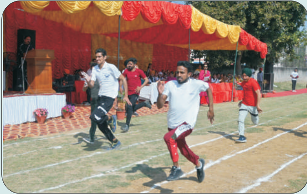
ਮਿਤੀ 25 ਫਰਵਰੀ 2023 ਨੂੰ ਸਾਲਾਨਾ ਖੇਡ ਸਮਾਰੋਹ ਵਿੱਚ ਭਾਗ ਲੈਂਦੇ ਹੋਏ ਵਿਦਿਆਰਥੀ