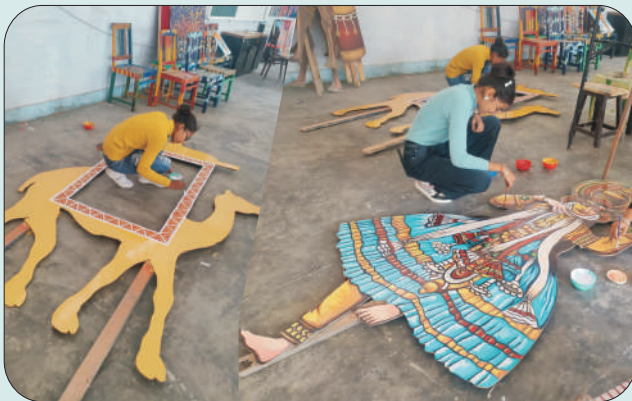
ਪਟਿਆਲਾ ਦੇ ਵਿਰਾਸਤੀ ਕਰਾਫਟ ਮੇਲੇ ਦੌਰਾਨ ਸਾਜ-ਸੱਜਾ ਦਾ ਸਮਾਨ ਤਿਆਰ ਕਰਦੇ ਹੋਏ ਕਾਲਜ ਦੇ ਫਾਇਨ ਆਰਟਸ ਦੀਆਂ ਵਿਦਿਆਰਥਣਾਂ