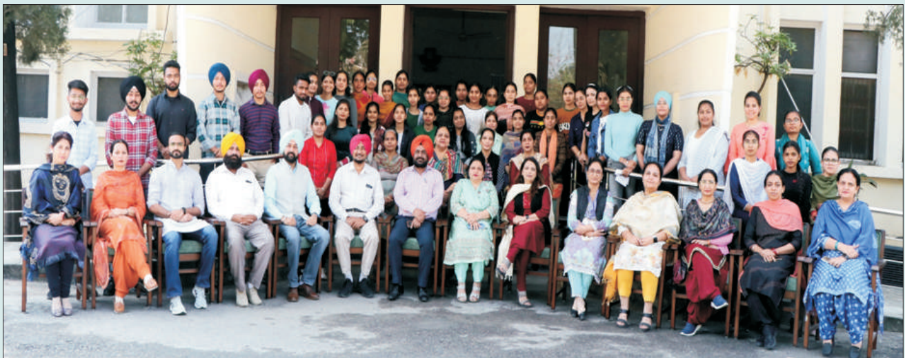
ਕਾਲਜ ਦੇ ਸੀ.ਟੈੱਟ. ਪ੍ਰੀਖਿਆ ਵਿੱਚੋਂ ਪਾਸ ਵਿਦਿਆਰਥੀ ਕਾਲਜ ਪ੍ਰਿੰਸੀਪਲ ਅਤੇ ਸਮੂਹ ਸਟਾਫ਼ ਦੇ ਨਾਲ