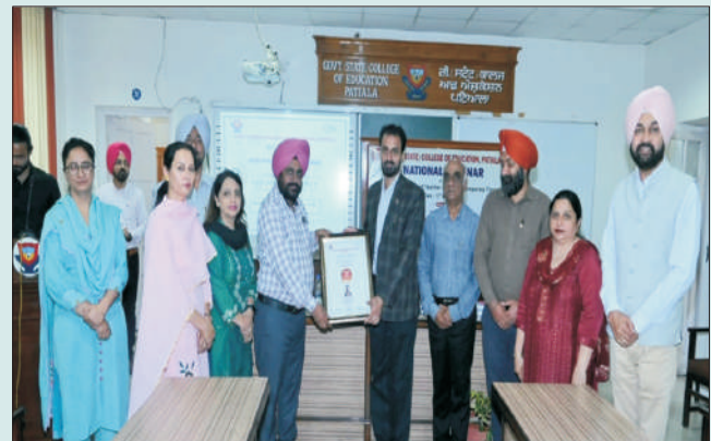
ਮਿਤੀ 13 ਮਾਰਚ 2023 ਨੂੰ ਰਾਸ਼ਟਰੀ ਸੈਮੀਨਾਰ ਦੇਰਾਨ ਪ੍ਰਿੰਸੀਪਲ, ਸਟਾਫ ਅਤੇ ਪਤਵੰਤੇ ਸੱਜਣ