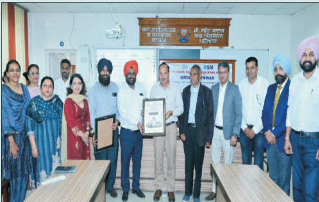
ਮਿਤੀ 10 ਮਾਰਚ 2023 ਨੂੰ ਰਾਸ਼ਟਰੀ ਸੈਮੀਨਾਰ ਦੇਰਾਨ ਪ੍ਰਿੰਸੀਪਲ, ਸਟਾਫ ਅਤੇ ਪਤਵੰਤੇ ਸੱਜਣ